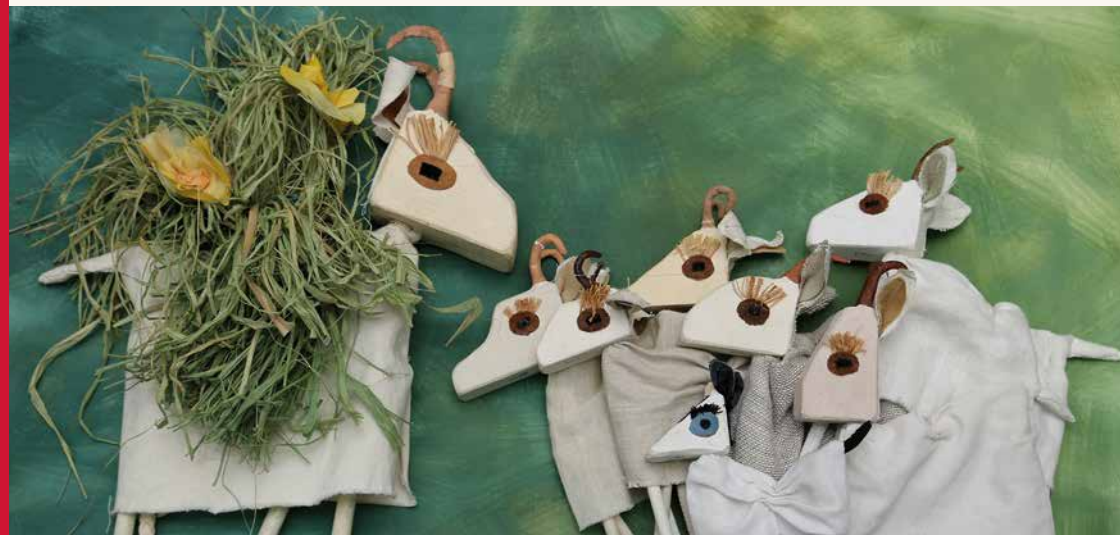
Der Wolf und die sieben Geißlein